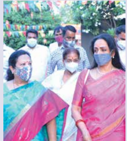
Smt. Darshana Vikram Jardosh, Hon'ble Minister of State for Textiles and Minister of State Railways