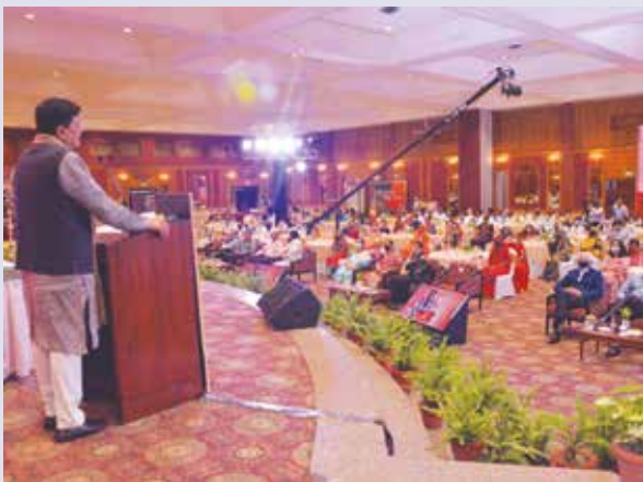
Shri Piyush Goyal, Hon'ble Minister of Commerce & Industry, Consumer Affairs & Food & Public Distribution and Textiles.