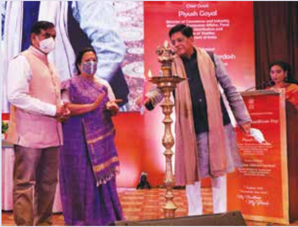
Inauguration of 7 th National Handloom Day by Shri Piyush Goyal, Hon'ble Minister of Commerce & Industry, Consumer Affairs & Food & Public Distribution and Textiles.