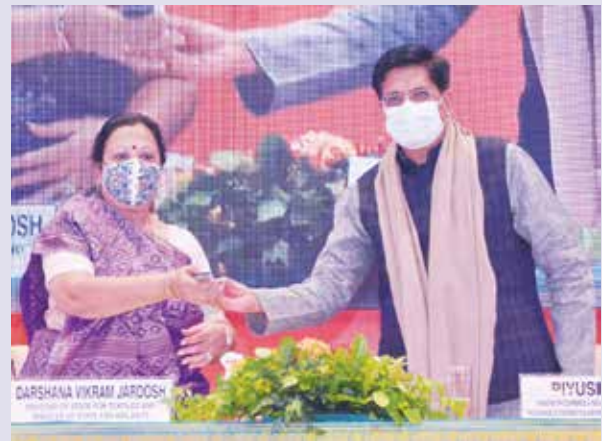
Inauguration of Virtual Buyers Sellers Meet of NHDC