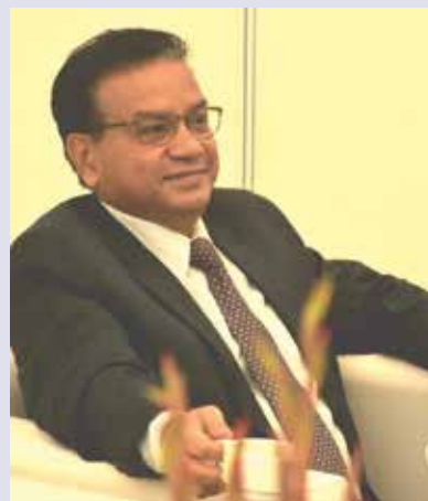
Shri Sanjay Rastogi Development Commissioner (Handlooms), Chairman-NHDC