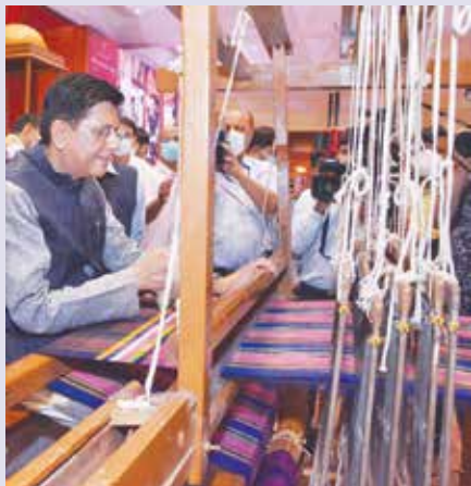
Shri Piyush Goyal, Hon'ble Minister of Commerce & Industry, Consumer Affairs & Food & Public Distribution and Textiles.