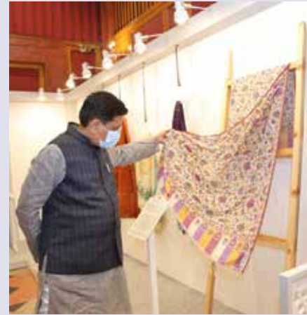
Shri Piyush Goyal, Hon'ble Minister of Commerce & Industry, Consumer Affairs & Food & Public Distribution and Textiles.