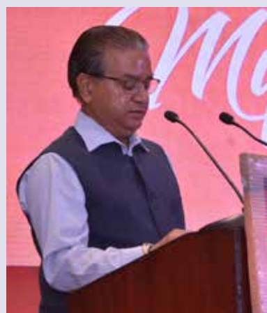
Shri Sanjay Rastogi Development Commissioner (Handlooms), Chairman-NHDC