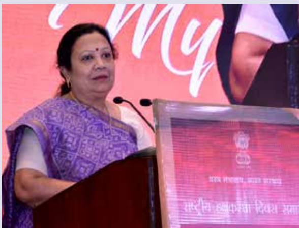
Smt. Darshana Vikram Jardosh, Hon'ble Minister of State for Textiles and Minister of State Railways