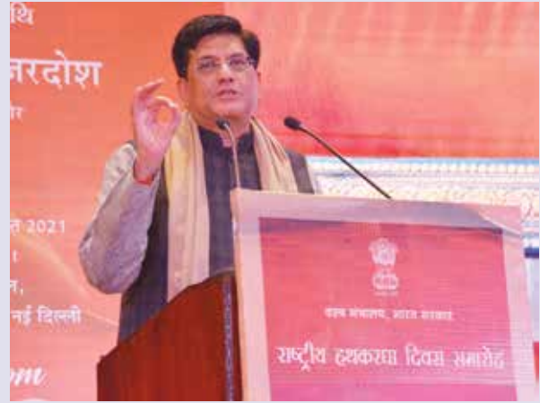
Shri Piyush Goyal, Hon'ble Minister of Commerce & Industry, Consumer Affairs & Food & Public Distribution and Textiles.