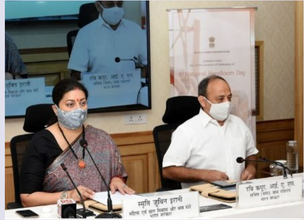
Inauguration of the 6 th National Handloom Day by Smt. Smriti Zubin Irani, the then Hon'ble Minister of Textiles; Hon'ble Minister of Women & Child Development